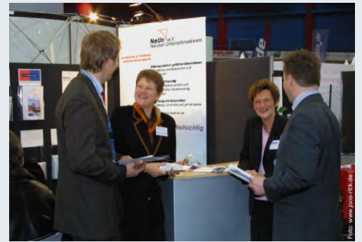
NeUn im Gespräch mit Interessenten