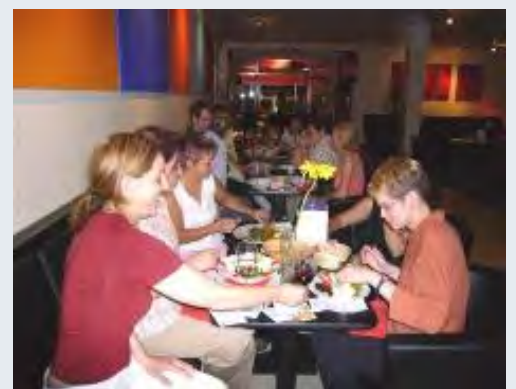
Wer Lust hatte, konnte den Abend in geselliger Runde ausklingen lassen.