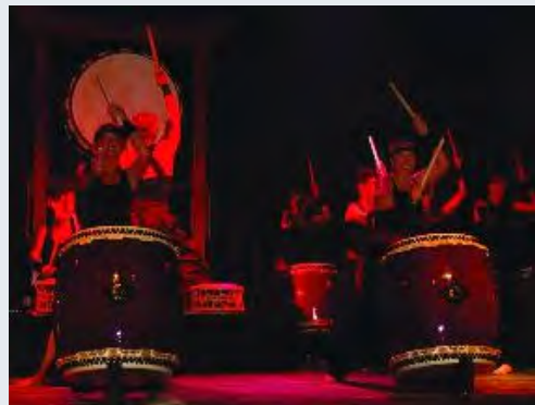
Der Tanz mit der Trommel.

Musik und Tradition spielten an diesem Abend eine Hauptrolle. Regelrecht zum Beben kam der Saal mit dem Auftritt der 8-köpfigen Gruppe TaikOdori, die ihre japanischen Trommeln mit spürbarer Power und sichtbarer Freude schlugen; präzise, athletisch, temporeich und faszinierend.