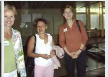
Viele Unternehmer/-Innen und Existenzgründer/-Innen nutzten den Abend zur Information und zum Erfahrungsaustausch.